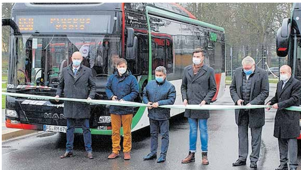
Der CHAMPLiner startete am 10. April feierlich mit Vertretern der Kommunen und der Landkreisverwaltung.

Auf der Linie 650 zwischen Penig und Chemnitz sind jetzt energieeffiziente Hybridbusse unterwegs. Damit können kurze Strecken, beispielsweise beim Abfahren von Haltestellen oder das Anfahren an Ampeln, vollständig elektrisch zurückgelegt werden. Der hierfür notwendige Strom wird vorrangig in Generatoren beim Bremsen erzeugt. Die somit zurückgewonnene Energie wird im Sommer 2019 erfolgreichen Ausbau der Linie 650 Chemnitz – Penig zur PlusBus-Linie folgt