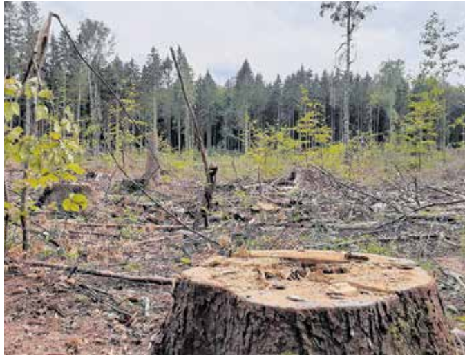
Der Wald wird sich verändern. Vielfältiger soll er werden. Die derzeit kahlen Stellen müssen wieder aufgeforstet werden.

Fallen den Förstern diesbezüglich Unzulänglichkeiten auf, werden die Waldbesitzer zunächst mit einem behördlichen Schreiben darauf und auf die Notwendigkeit einer schnellen Beseitigung vom Käfer befallener Bäume hingewiesen. Waldbesitzer, die diese Notwendigkeit nicht erkennen oder ihre Möglichkeiten überschätzen, werden nach den Maßgaben des Wald- und Pflanzenschutzrechtes in die Verantwortung