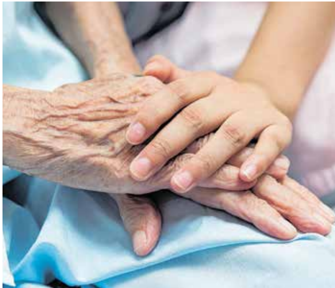
Rund 250 000 Pflegebedürftige gab es 2019 in Sachsen.