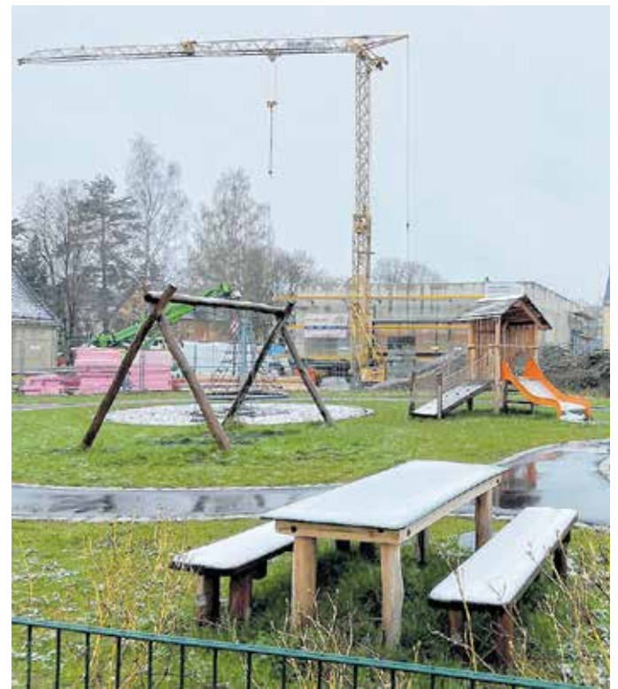
Ein Blick auf die aktuellen Arbeiten auf dem Gelände der Schule mit Förderschwerpunkt in Flöha.

Aufgrund einer starken Nachfrage nach Restabfallbehältern und entsprechend mehr Entleerungen stiegen die Einnahmen der Fest- und Entleerungsgebühren an. Gleichzeitig mussten nur relativ geringe Kostensteigerungen verkräftet werden. Drohende enorme Anhebungen der Abfallbeseitigungsgebühren für den Altkreis Döbeln konnten verhindert werden. Die geplante Sanierung der Altdeponie